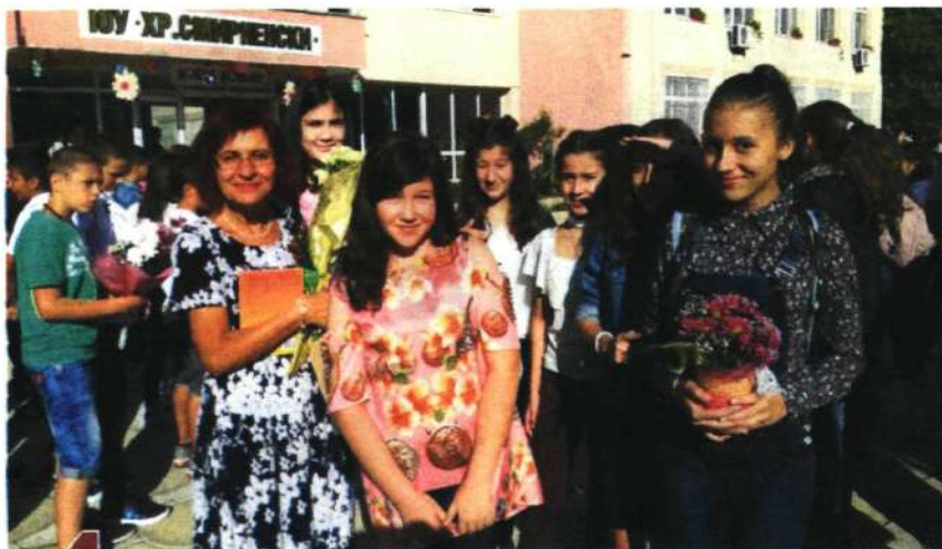
Учителката и нейните ученици - радостни срещи, които се помнят дълго.